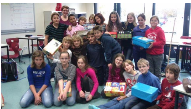
Das Beste, was aus Schuhkartons werden konnte