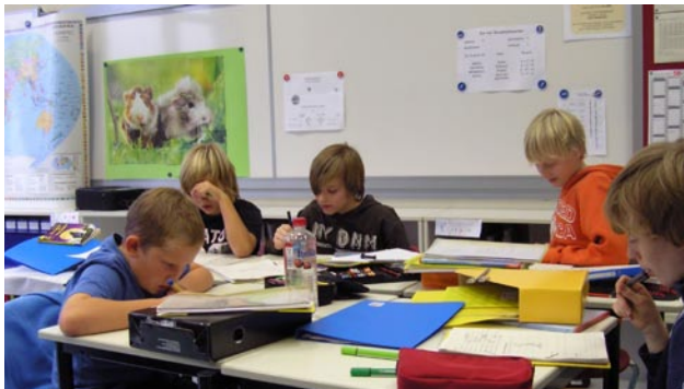
Selbstständiges Arbeiten im Unterricht

Die meisten schaffen es inzwischen recht gut, ihren häufig anstrengenden Alltag zu meistern. Sie sind motiviert