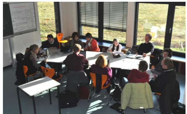
In den Arbeitsgruppen werden die Projekte entwickelt

Am stärksten werden voraussichtlich die Fächer Deutsch, Geschichte und Politik und Wirtschaft an den Projekten beteiligt sein. Aber auch Englisch, Mathematik und Physik werden spürbar vertreten sein. Mit der Erarbeitung