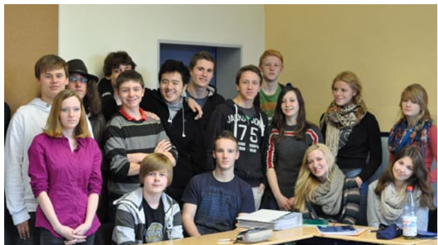
Wer ist G8 und wer G9?

» Von dem, was ich beobachten kann, ist es bei allen Schülern kein Problem, miteinander zu arbeiten.