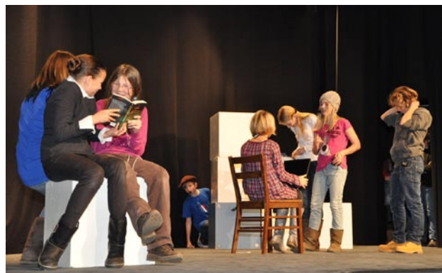
Auf der Bühne ging's auch Französisch zu

Witzig war das Unterfangen der DS Gruppe von Herrn Finance, die dem Publikum am Beispiel einer Anmacher-