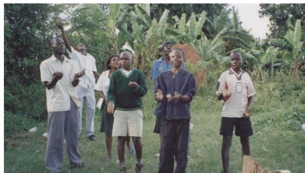
Jugendliche vom RAINBOW HOUSE OF HOPE

Im Herbst 2010 waren zwei Gründungsmitglieder der Organisation aus Ostafrika an der Steinmühle zu Besuch